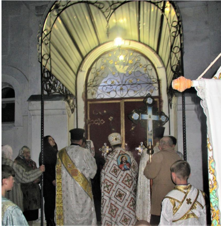
Prästerna utanför kyrkporten

Folket går så in i kyrkan och fortsätter att sjunga påskmatutinen och sedan den heliga liturgin