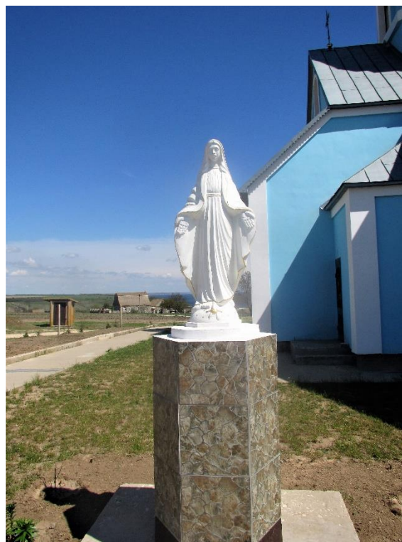
Den Heliga Jungfrun

Kyrkan invigdes i december 2017 och ersatte det kapell som tidigare varit församlingens gudstjänstlokal. Vid sidan av kyrkan finns numera en Mariastaty som är alldeles nyuppförd.