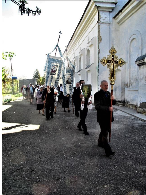
Procession runt kyrkan