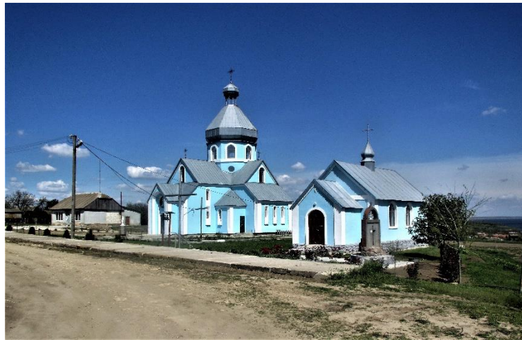
Affären, kyrkan och kapellet

Därefter går vi till den utsökt vackra grekisk-katolska kyrkan, där vi också kan beundra den storslagna utsikten över Dnipro.