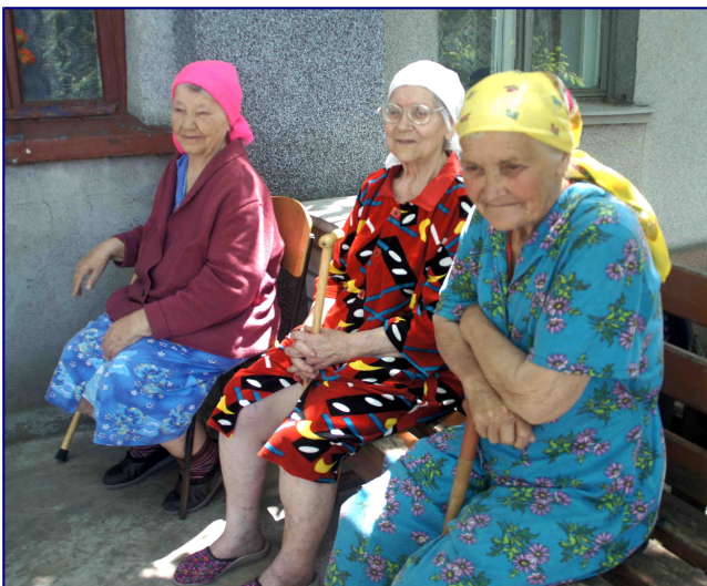
Några av de äldre damerna som bor på hemmet