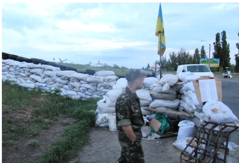
Barrikader vid kraftstationen

Hemåt åker vi via Nova Kachovka, där vi stannar till vid barrikaderna nära kraftverket och samtalar med de frivilliga som tjänstgör där. De har bland annat ställt upp ett pansarskyttefordon (BTR) med kulsprutan riktad österut bakom en betongbarrikad. Det är tveksamt om det rör sig om ett fungerande stridsfordon eller om det bara finns där som en symbol för landets avsikt att försvara sig.