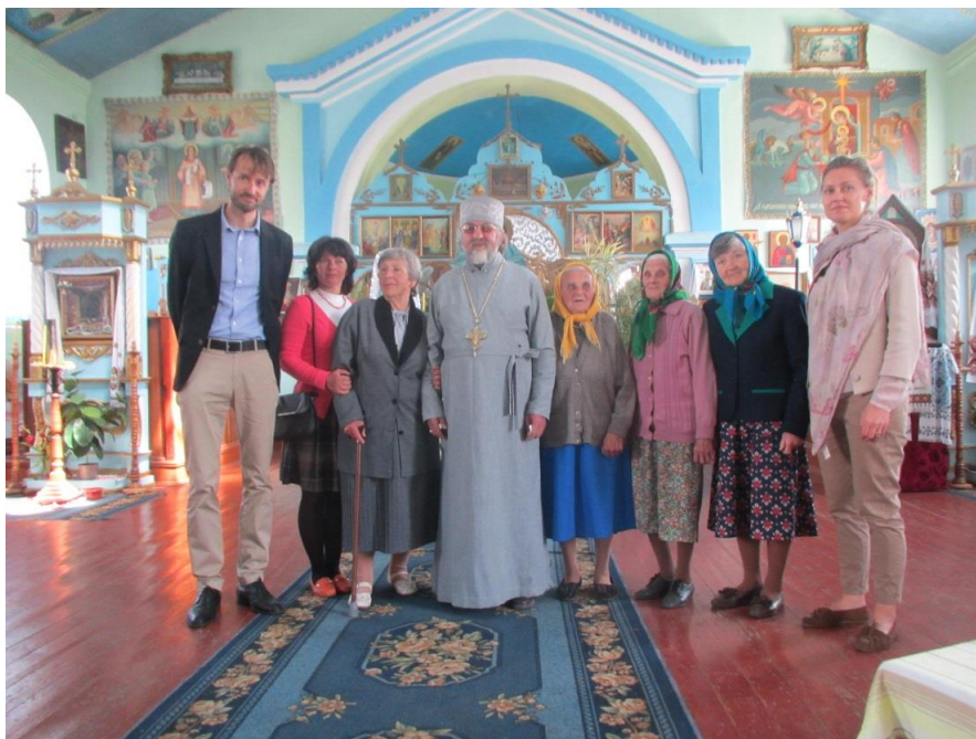
Några bybor med ambassadörsparet i kyrkan