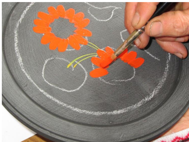
En konsthantverkare i arbete

Vårt första mål är byn Petrykivka (ry. Petrikovka) med dess unika folkkonst. I museet får vi förutom en utställning också se hantverkare och konstnärer i arbete. Olika mönster växer fram.