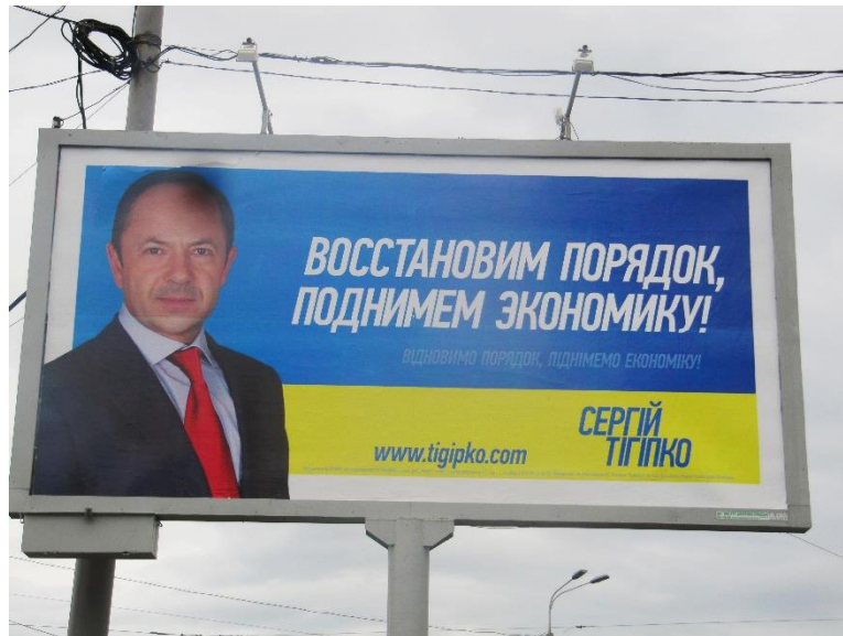
Valaffisch med Serhij Tihipko

Och så länge Ukraina förblir en bricka i det maktpolitiska spelet, torde en verklig lösning av krisen ligga lång borta