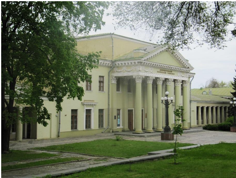
Potemkins palats i Dnipropetrovsk

Men så småningom kommer vi till mera intressanta delar och när vi sedan gör en vandring i centrum kan vi inte klaga på de sevärdheter som visas, bland annat Potemkins palats som färdigställdes långt efter hans död.