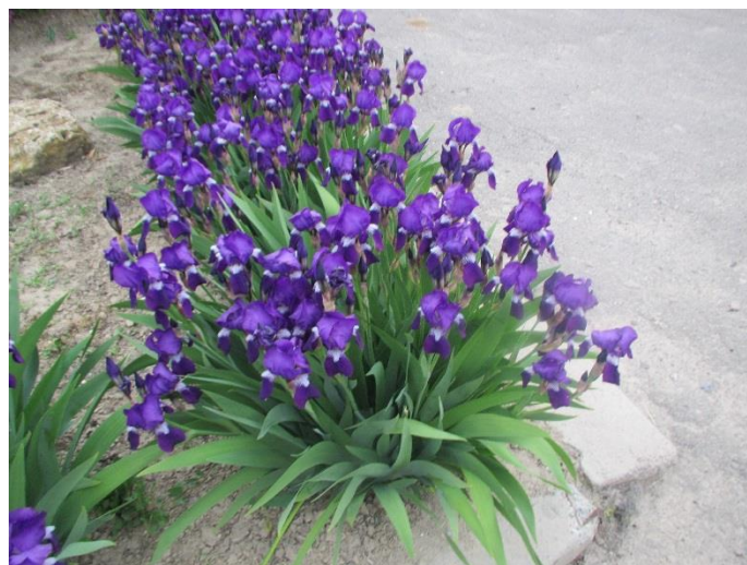
En blommande Iris

Kylan fortsätter och det hörs inte heller så många härfåglar, bara ett och annat av den säregna fågelns gökliknande läte. Men många blommor lever ett liv i högönsklig välmåga.